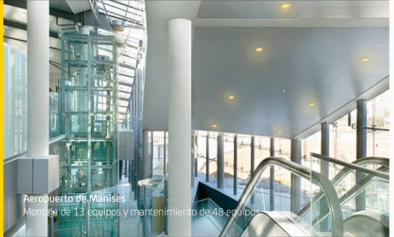
Aeropuerto de Manises Montaje de 13 equipos y mantenimiento de 48 equipos

FAIN le ofrece la mejor oferta con el mejor servicio en mantenimiento de ascensores.