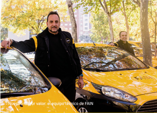
Nuestro mayor valor: el equipo técnico de FAIN